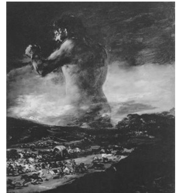
„El Coloso“ de Francisco Goya y Lucientes