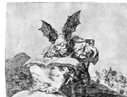
Goya: "Contra el bien general"

Vom Donnerstag, der 26. Juni bis zum Freitag, den 11. Juli